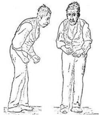
Tekening uit Wikipedia.